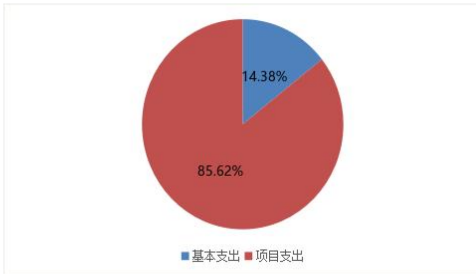
图 2：基本支出和项目支出情况